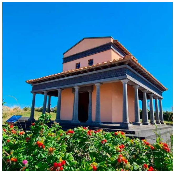
Nagebouwde tempel van Nehalennia op Colijnsplaat

verhandeld. Het schaarse onderzoek naar nog onontdekte bodemschatten, bleek vooral te rusten op de schouders van hen die zich door persoonlijke bevoegenheid daartoe aangetrokken voelden. Daarin waren met name gewone burgers actief die door het Nehalennia-virus waren gegrepen. In 2006 werd gemeld dat een team van Belgische duikers de moed nog niet had opgegeven. Vanuit Belgisch Limburg, zo'n tweehonderd kilometer bij de Oosterschelde vandaan, reisden ze steeds naar Zeeland om met een duikteam dit oude erfgoed veilig te stellen. Kerkvaders en machthebbers zagen de godin het liefst verdwijnen en dus werd geïnteresseerden opnieuw maar wat op de mouw gespeld. Het was een herhaling van het oude verhaal dat ging over een lokale afgodin die geloften inlostte en dan nadien bedankt werd door een stenen plak met daarop haar beeltenis en naam in het water te werpen. En velen zijn dat blijven geloven en praten dat maar wat na. Zonder uitgebreid onderzoek te hebben gedaan, wordt nog steeds beweerd dat het hier vooral een Zeeuwse godin betrof. Maar... dat is helemaal niet waar!