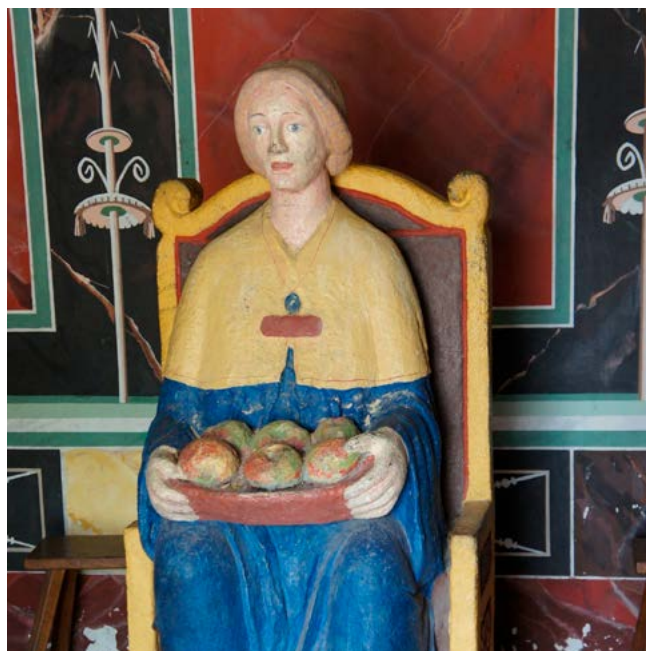
Nehalennia in het tempelhuis van Archeon

Ook buiten Nederland was van alles gevonden, onder andere in Brussel. Reliëfplakken ten gunste van Nehalennia en andere naar haar verwijzende artefacten werden gevonden in de Vogezen, opgegraven in onder andere het Duitse Pesch, Deutz en Keulen. Ook richting Luxemburg en in de omgeving van Trier waren sporen gevonden van de godin, men stuitte daar namelijk op marmeren beelden die er hetzelfde uitzagen als in Rhenen en Nijmegen gevonden sculpturen van Nehalennia. In het Juragebergte werd nabij de Zwitserse grens een bronzen beeld gevonden. Op een mozaïek in het Franse Nîmes stond de godin eveneens weergegeven en ik heb daar ook een oude aan haar gewijde tempel ontdekt. De Franse bodem bleek vol te liggen met beeltenissen van deze godin en ik stuitte op allerlei beschrijvingen van tempels waarin de godin vereerd was, die gevestigd waren door het hele land. Kleine bas-reliëfs werden aangetroffen in de ruïnes van het bos van Fremifontaine, beelden gevonden in Sommerécourt, een reliëf en inscripties in Grand, kleine zandstenen beeldjes in Escles en beelden van Nehalennia werden tevens aangetroffen in de ruïnes van de Église Saint-Marcel in Parijs. Nehalennia was zeer geliefd in Frankrijk en zelfs in het verleden in iedere straat van Bordeaux afgebeeld. Talloze sporen in Frankrijk verwijzen naar de godin, teveel om in dit artikel op te noemen. De verering van de godin wortelde duidelijk veel dieper in de Europese geschiedenis